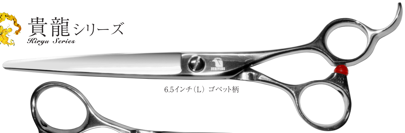
6.5インチ(L) ゴベット柄