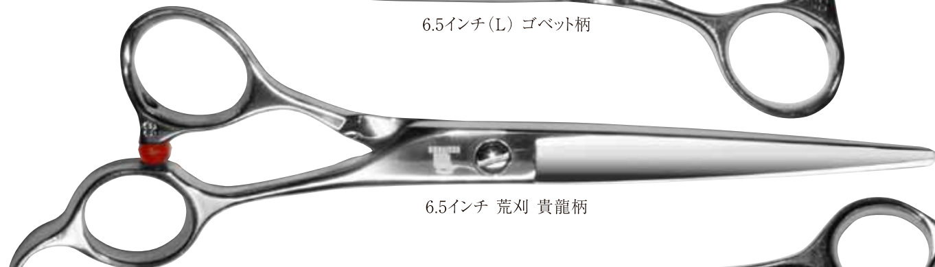
6.5インチ 荒刈 貴龍柄