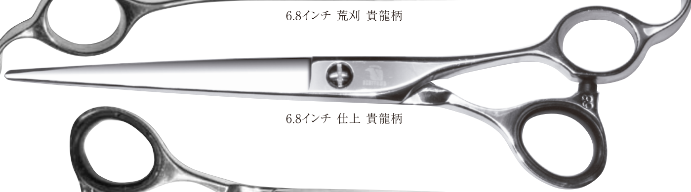
6.8インチ 仕上 貴龍柄