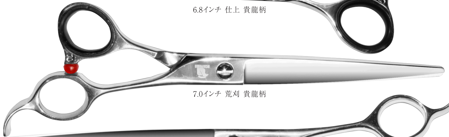
7.0インチ 荒刈 貴龍柄