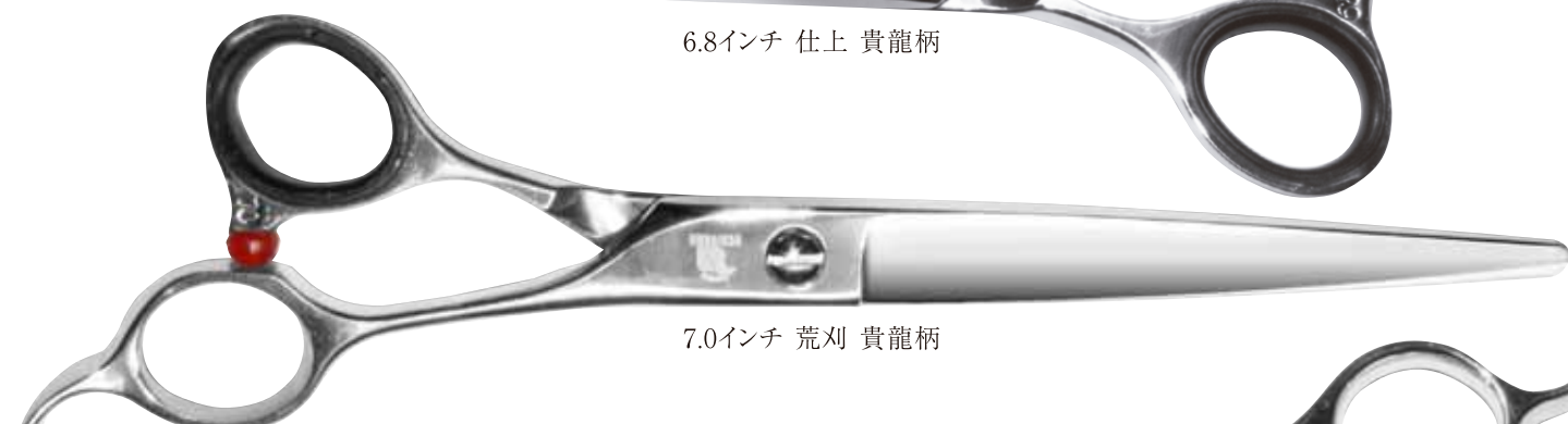
7.0インチ 荒刈 貴龍柄