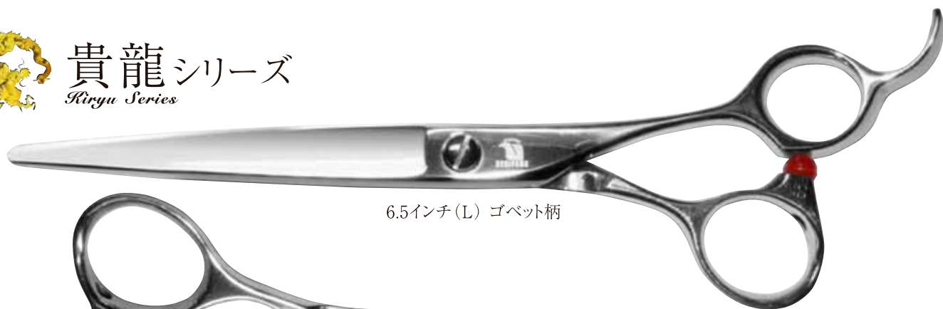
6.5インチ(L) ゴベット柄