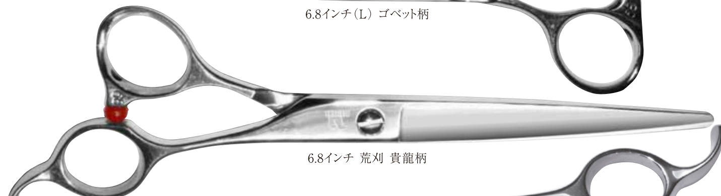
6.8インチ 荒刈 貴龍柄