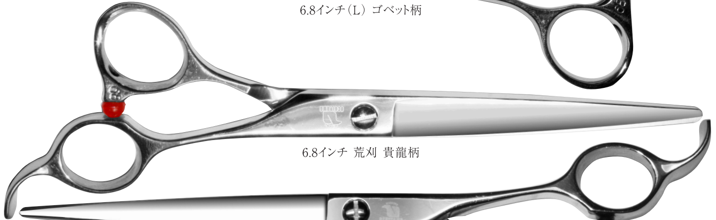
6.8インチ 荒刈 貴龍柄