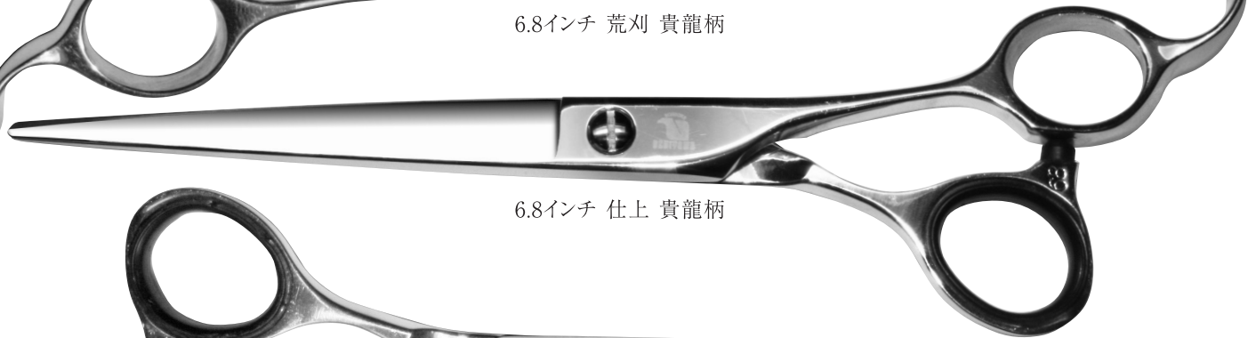
6.8インチ 仕上 貴龍柄