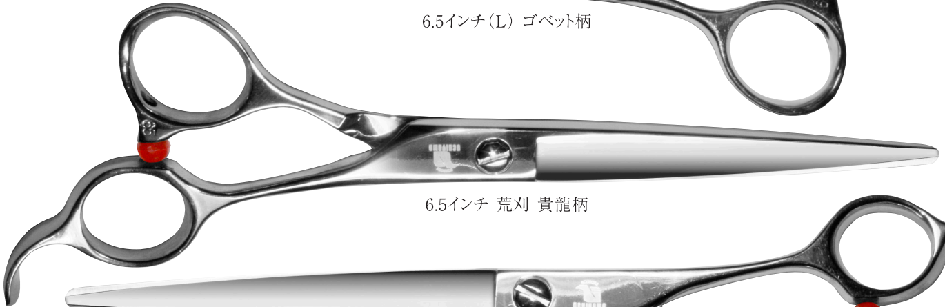
6.5インチ 荒刈 貴龍柄