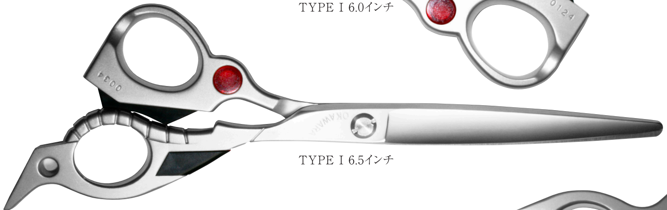
TYPE I 6.5インチ