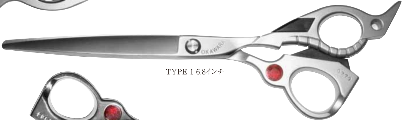
TYPE I 6.8インチ