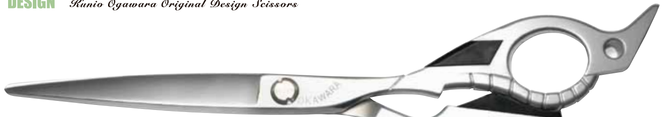
TYPE I 6.0インチ