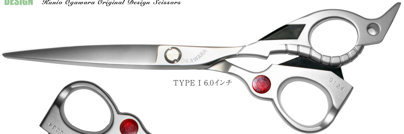
TYPE I 6.0インチ