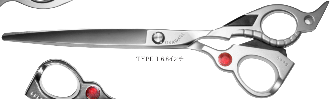
TYPE I 6.8インチ